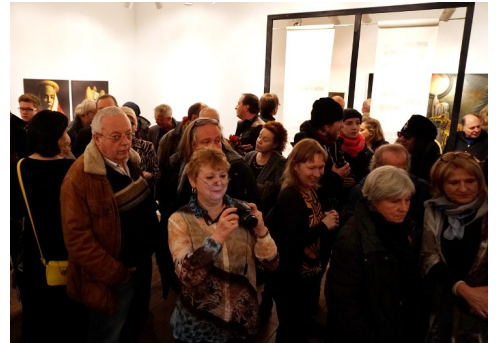
„Mutabor“, 06.-20.01.2017